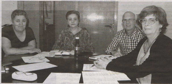
Batzordeko kideak, bilduta. Eragile ezberdinen ekarpenekin osatu nahi dute Udalaren Berdintasun Plana.

Idoak Nafarroako berdintasun teknikariek, Nafarroako Gobernuaren Berdintasunerako Institutuak eta Nafarroako Udal eta Kontzejuen Federazioak udal taldeko berdintasun planak egiteko 2014an adostutako planingintzan oinarrituta dago Altsasun onartutako zirrriborroa. Berdintasuna lortzeko bestelako estrategia zehatu dituzte. Lehenik, etxeratik begira jarri dira: emakumezkoen eta gizonezkoen arteko berdintasuna udal administrazioan zehar lerroa izanen da. Bigarrenik, Emakumeenganak indarkeriarren kontrako prebentzioa eta ezabatzea lan eginen da. Horrekin batera, emakumezkoen arloan guztiz integratzeko eta garatzeko