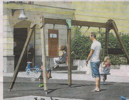
Uno de los ámbitos propuestos es la corresponsabilidad y conciliación.

ALTSASU - El Ayuntamiento de Alsasua ha abierto un proceso de participación pública para la elaboración del segundo Plan de Igualdad a los años 2016-2019 es de su aprobación por parte del Pleno. Las aportaciones se podrán realizar a partir del 8 de julio en la dirección de correo electrónico berdintasuna@alsasua.net . El plan está colgado en la municipal www.alsasua.net , donde se puede encontrar un documento introductorio que recoge el trabajo realizado y la evaluación del primer plan así como con las medidas a desarrollar en los próximos años, lo que se recogerán en las generales de actuación, se concretará en planes anuales para las que se requerirá el consenso de las entidades implicadas, según explican desde el Ayuntamiento de Alsasua. El primer plan de igualdad municipal para las áreas de igualdad de mujeres y hombres se aprobó en abril de 2008