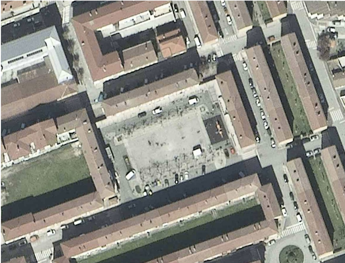
2019. urteko ortoargazkia.

Zumalakarregi Plazako ortoargazkietan ikus daitekeenez, jarduketa berrurbanizazio integrala egitea izan da, espazio askoz ere erabilgarriago bihurtuz (irisgarria, oinezkoen erabilera indartuta, haurrentzako jolasetarako gunearekin, eguzki-babeseko pergolarekin):