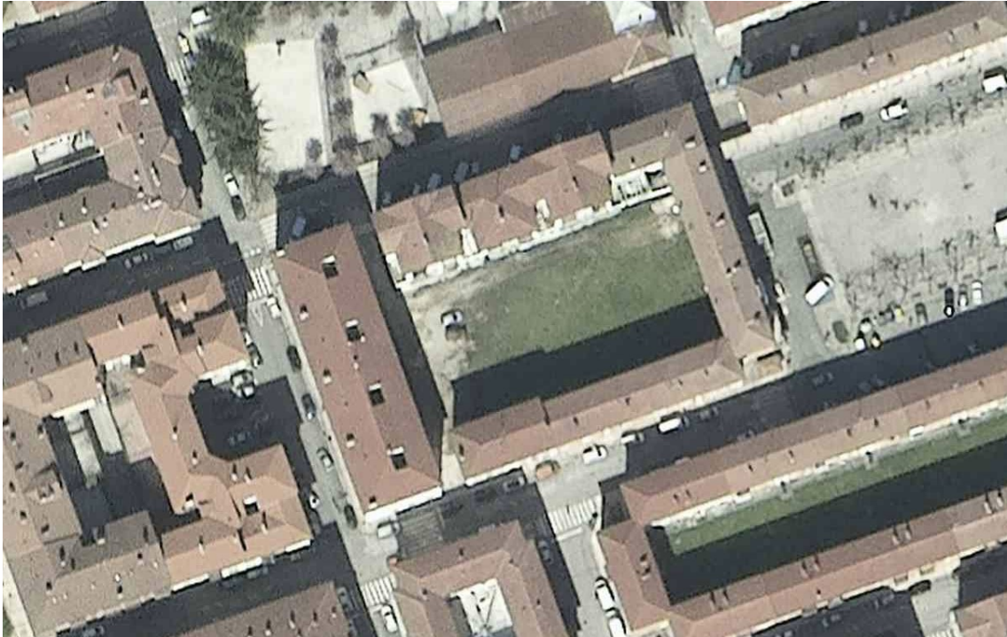
2019. urteko ortoargazkia. Zumalakarregi plazaren (6 eta 7) eta Bake kalearen (36, 38 eta 40) atzeko barruko plaza erdi-abandonatuta dagoela ikusten da argazki honetan.