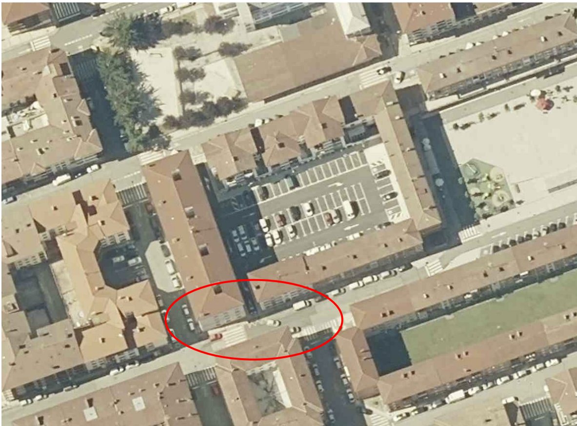
2021. urteko ortoargazkia. Barruko plaza osorik berrurbanizatu dela ikus daiteke. Barruko plazako jarduketaz gain (orain aparkatzeko gunea, espaloiak, argiteria publikoa eta euri-uren bilketa dituzte), Bakea kaleko zati batean esku hartu da euri-uren kolektorea konpontzeko, oso hondatuta baitzegoen (gorriz seinalatu da).