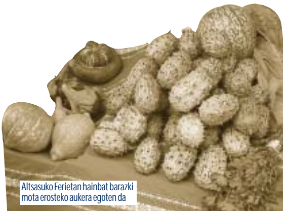
Altsasuko Ferietan hainbat barazki mota erosteko aukera egoten da

El sector primario se encuentra en una situación difícil apenas hay media docenas de explotaciones ganaderas en nuestro pueblo. Por eso desde el Ayuntamiento, en la medida que podamos, debemos apoyar a éste sector. Por otra parte, con la desaparición del ganado de nuestros montes, cada vez es más difícil el mantener los montes limpios. Por