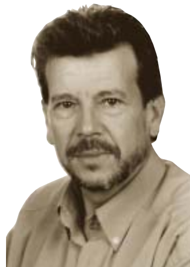
AGRUPACIÓN SOCIALISTA DE ALSASUA

Después de 9 meses de legislatura, el gobierno municipal, se reparte entre EA, AA, IU y Aralar, y la gente de nuestro pueblo se pregunta, ¿pero quien gobierna nuestro pueblo? Pues eso, que no hay gobierno.