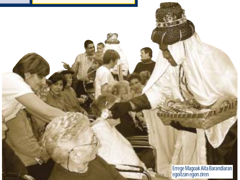
Errege Magoak Aita Barandiaran egoitzan egon ziren

Sin querer tirar balones fuera, a nuestro grupo nos gusta la seriedad y la responsabilidad pero, contamos con los medios económicos que tene-