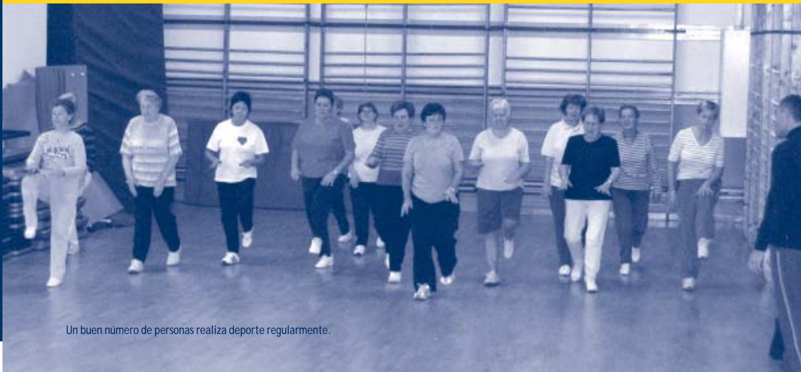
Un buen número de personas realiza deporte regularmente.

El área de juventud ha abierto un segundo plazo de inscripción para los siguientes: Euskal Jokoak, encuadernación artesanal y pintar textiles . ¡Anímate!