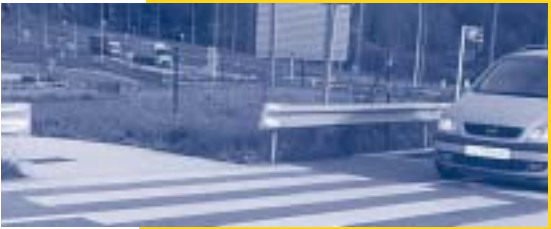
Puntu arriskutsu horretarako seinale gehiago eskatu dituzte autobiatik sartzen diren ibilgailuei oinezkoen pasabidea dagoela ohartarazteko.