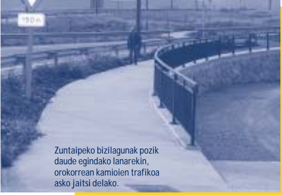
Zuntaipeko bizilagunak pozik daude egindako lanarekin, orokorrean kamioien trafikoa asko jaitsi delako.

El número de camiones que transita por el barrio ha disminuido considerablemente.